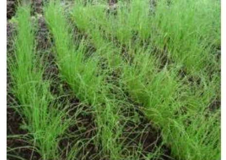
Kitalu cha vitunguu

Ni muhimu kumwagilia maji ya kutosha siku kumi za mwanzo tangu kusia mbegu kitaluni. Vitunguu hukaa kitaluni kwa wiki 6-8 na miche ifikiapo upana wa penseli na urefu wa sm 15 ni tayari kwa kuhamishia shambani/bustanini.